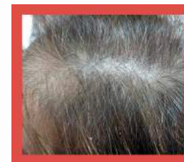
alopecia estrone carenziale

Il Corso prevede due Domeniche di formazione, dalle 9,30 alle 17,00, in cui il discente potrà imparare quelle che sono le tecniche e le terapie attuali utili a contrastare la caduta e la perdita dei capelli.